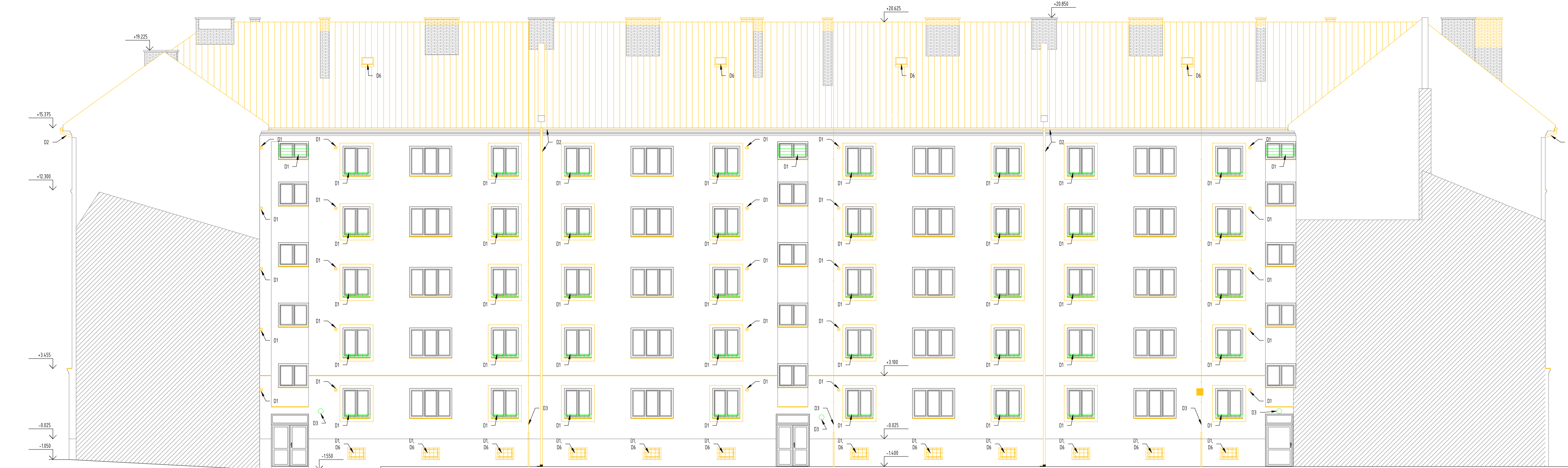
POHLED BOČNÍ ZE DVORA